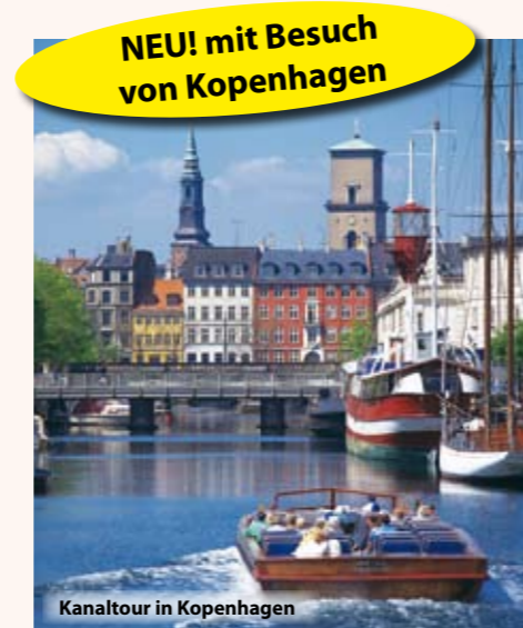
Kanaltour in Kopenhagen