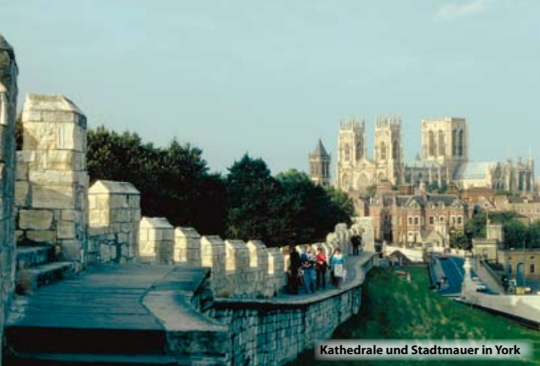
Kathedrale und Stadtmauer in York