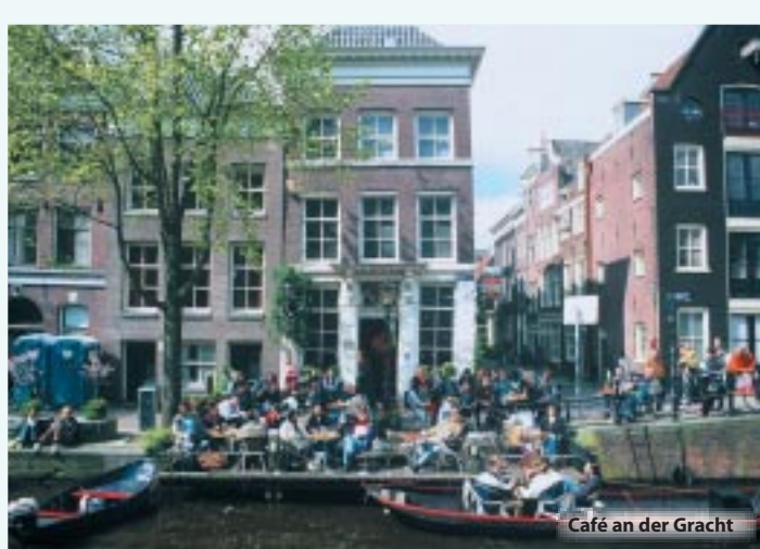
Café an der Gracht