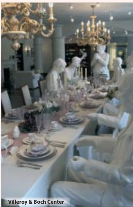
Villeroy & Boch Center

Hotel „Zum Mühlengarten“: An der reizvollen Obermosel liegt unser Hotel „Zum Mühlengarten“. Alle Zimmer mit Bad oder Dusche / WC und Sat-TV. Außerdem finden Sie im Haus ein sehr gutes Restaurant, den gemütlichen Biergarten mit Mühlrad und von der Terrasse genießen Sie bei einem guten Wein einen wunderschönen Blick über die Mosel auf die nahen Weinberge. Hoteladresse: Uferstraße 5, 54453 Nittel. Tel.: 06584/420.