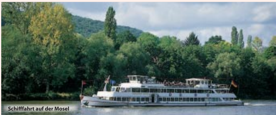
Schiffahrt auf der Mosel

Freuen Sie sich auf gemütliche Tage in einer sehr schönen Weinregion und einem ansprechenden Rahmenprogramm mit tollem Leistungsumfang.