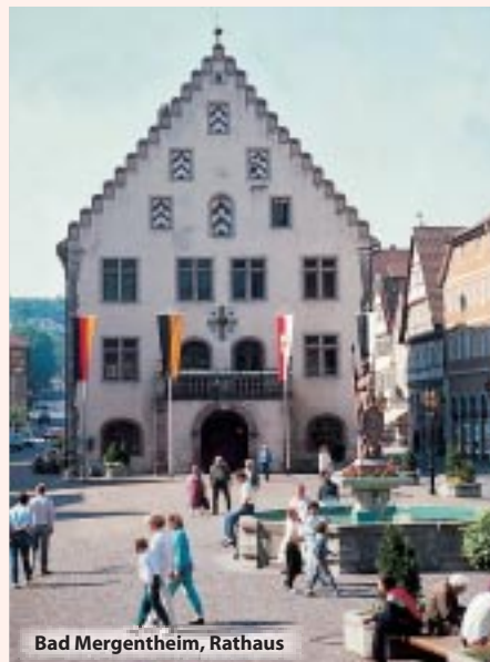
Bad Mergentheim, Rathaus

3. Tag: Nach dem Frühstück verlassen wir Rothenburg und begeben uns auf Stippvisite in die unterfränkische Stadt Aschaffenburg mit seinem malerisch am Main gelegenen wunderschönen Schloss Johannisburg. Bei einer Mainschleifenschiffahrt erleben Sie nun das „bayerische Nizza“ aus einmaliger Perspektive. Anschließend haben Sie Freizeit für einen Bummel durch die romantische Altstadt oder können einen Schoppen Wein in schöner Atmosphäre in der Gutsschänke des Schlosses genießen. Im Anschluss erfolgt die Heimreise.