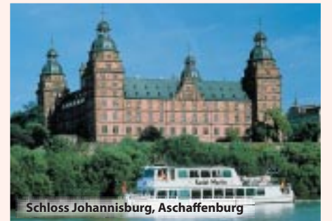
Schloss Johannisburg, Aschaffenburg

Hotel Gasthof Linde: Zentral gelegener Gasthof mit vorzüglicher fränkischer und bayerischer Küche, alle Zimmer mit Bad oder Dusche/WC, TV, Telefon und Modem für ISDN-Anschluss ausgestattet. Das Hotel verfügt über einen Fahrstuhl. Adresse: Vorm Würzburger Tor 12, 91541 Rothenburg ob der Tauber, Tel 09861/94690 oder gleichwertiges Hotel.