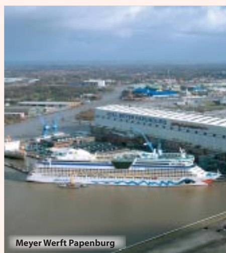
Meyer Werft Papenburg