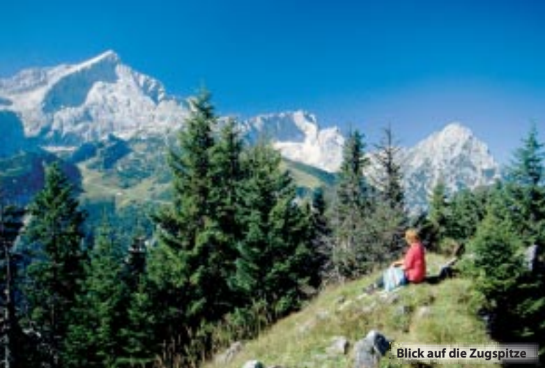
Blick auf die Zugspitze