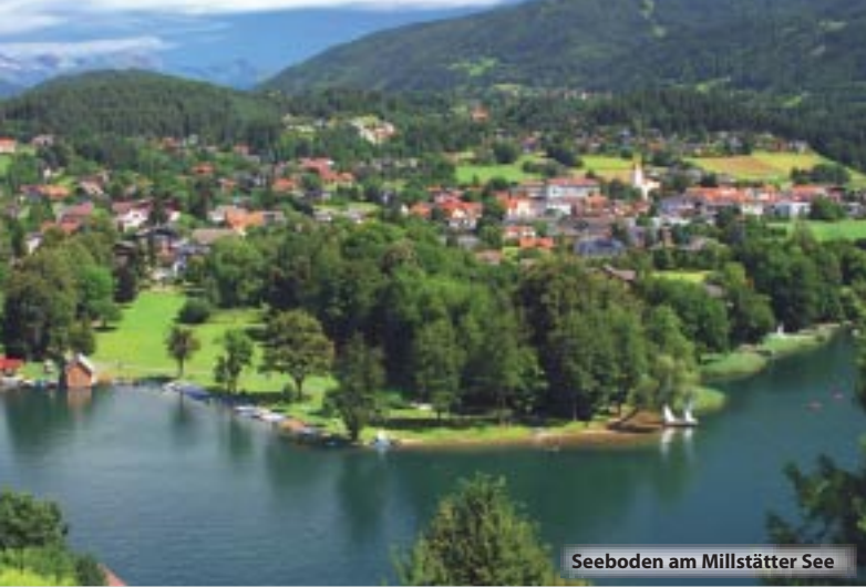
Seeboden am Millstätter See