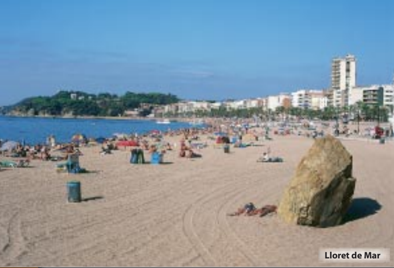
Lloret de Mar